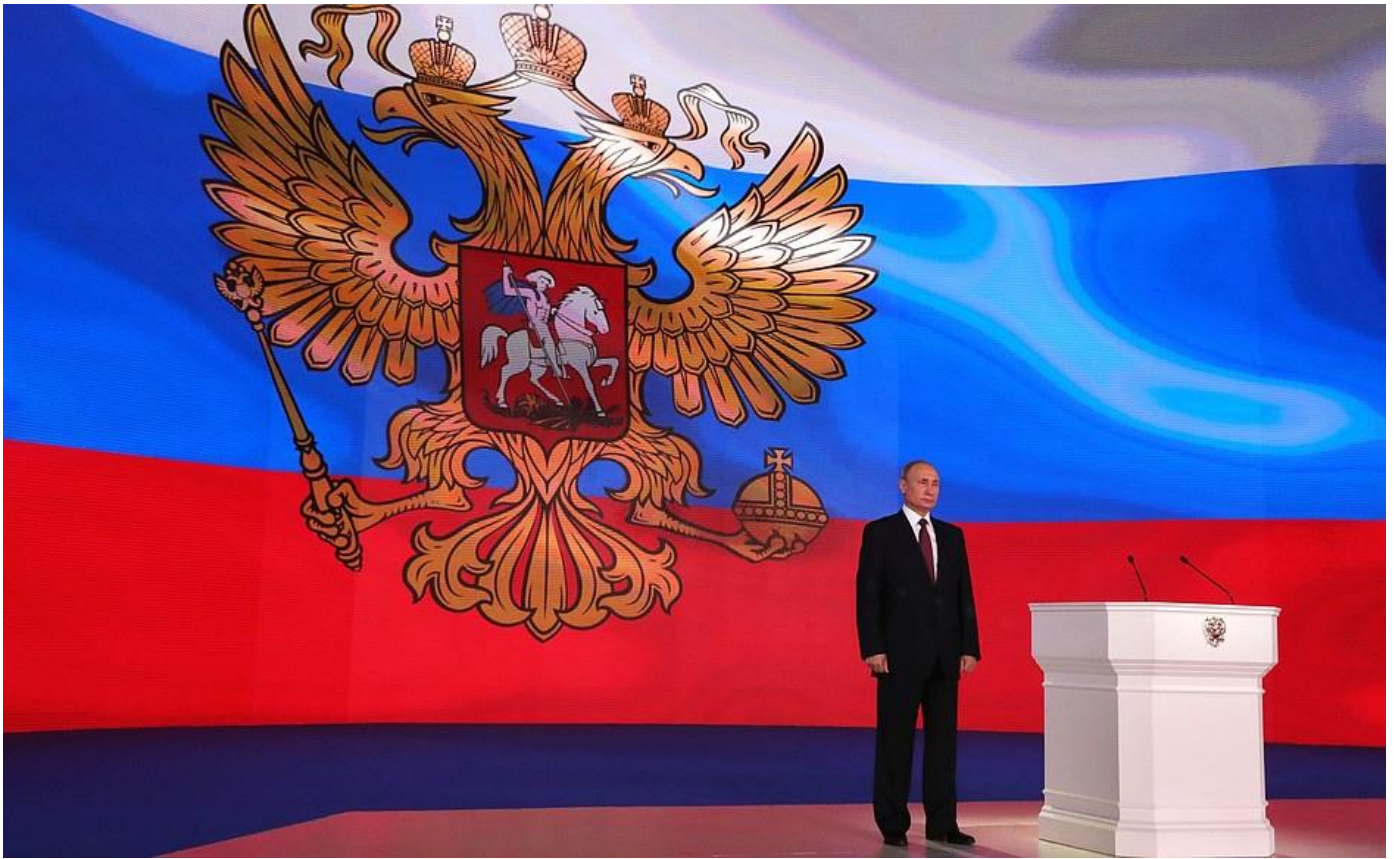
Послание Президента Федеральному Собранию.

Мы будем наращивать этот потенциал, концентрировать эти возможности на решении тех масштабных задач, которые стоят перед страной в экономике, в социальной сфере, в инфраструктуре. И такое уверенное долгосрочное развитие России всегда будет надёжно защищено.