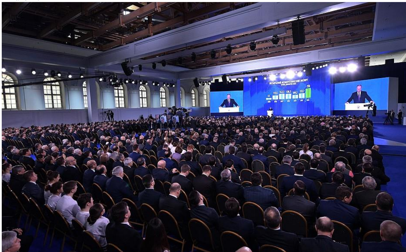
Послание Президента Федеральному Собранию.

Мы долго уговаривали американцев не разрушать Договор о ПРО, не нарушать стратегического баланса. Всё тщетно. В 2002 году США в одностороннем порядке вышли из этого договора. Но даже после этого мы ещё долго пытались наладить с ними конструктивный диалог. Предлагали для снятия озабоченности и сохранения атмосферы доверия наладить совместную работу в этой области. В какой-то момент мне показалось, что компромисс может быть найден, но нет. Все наши предложения, именно все наши предложения были отклонены. Мы заявили тогда, что будем вынуждены для обеспечения своей собственной безопасности совершенствовать современные ударные комплексы. В ответ нам было сказано: «США создают систему глобальной ПРО не против вас, не против России, а вы делайте что хотите. Будем исходить из того, что это не против нас, не против Соединённых Штатов».