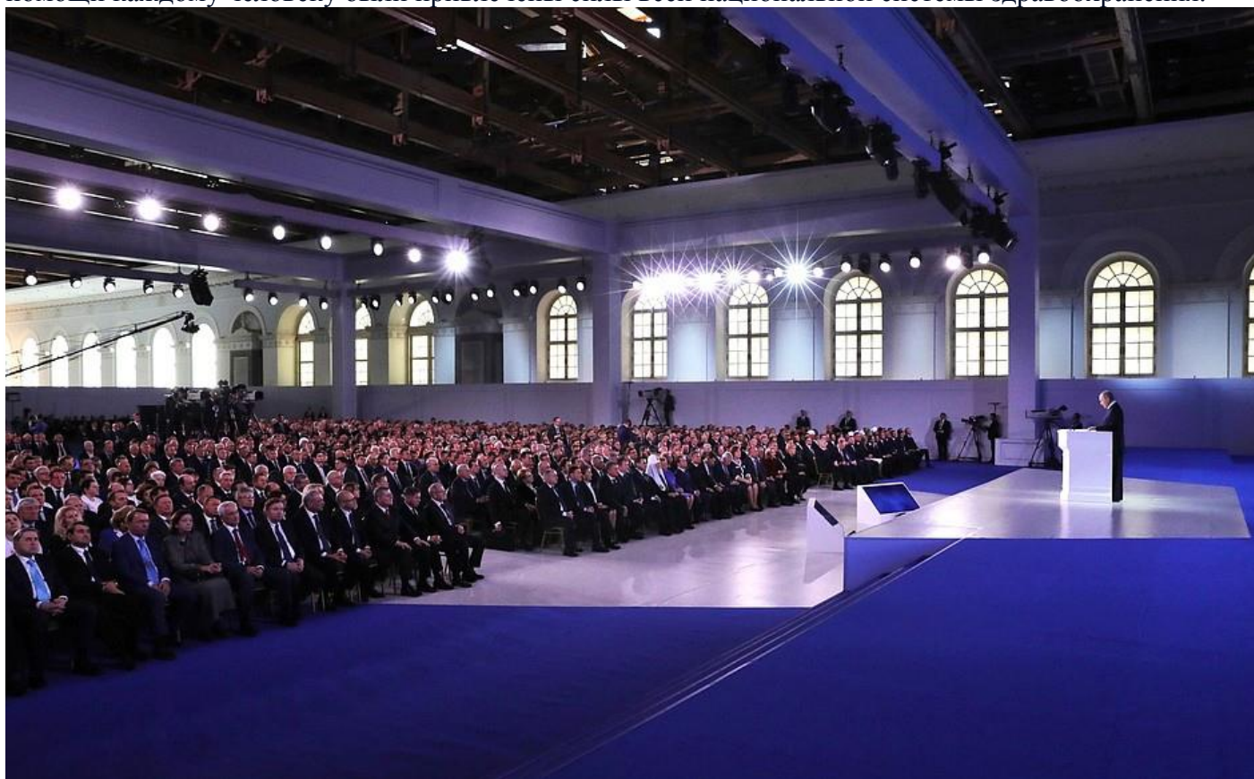
Послание Президента Федеральному Собранию.

Нужно держать под контролем исполнение этих задач. Считаю их крайне важными. И прошу также Общероссийский народный фронт находиться в контакте с гражданами, вести мониторинг ситуации на местах. При этом поликлиники и фельдшерско-акушерские пункты, региональные учреждения здравоохранения и ведущие медцентры должны быть связаны в единый цифровой контур, чтобы для помощи каждому человеку были привлечены силы всей национальной системы здравоохранения.