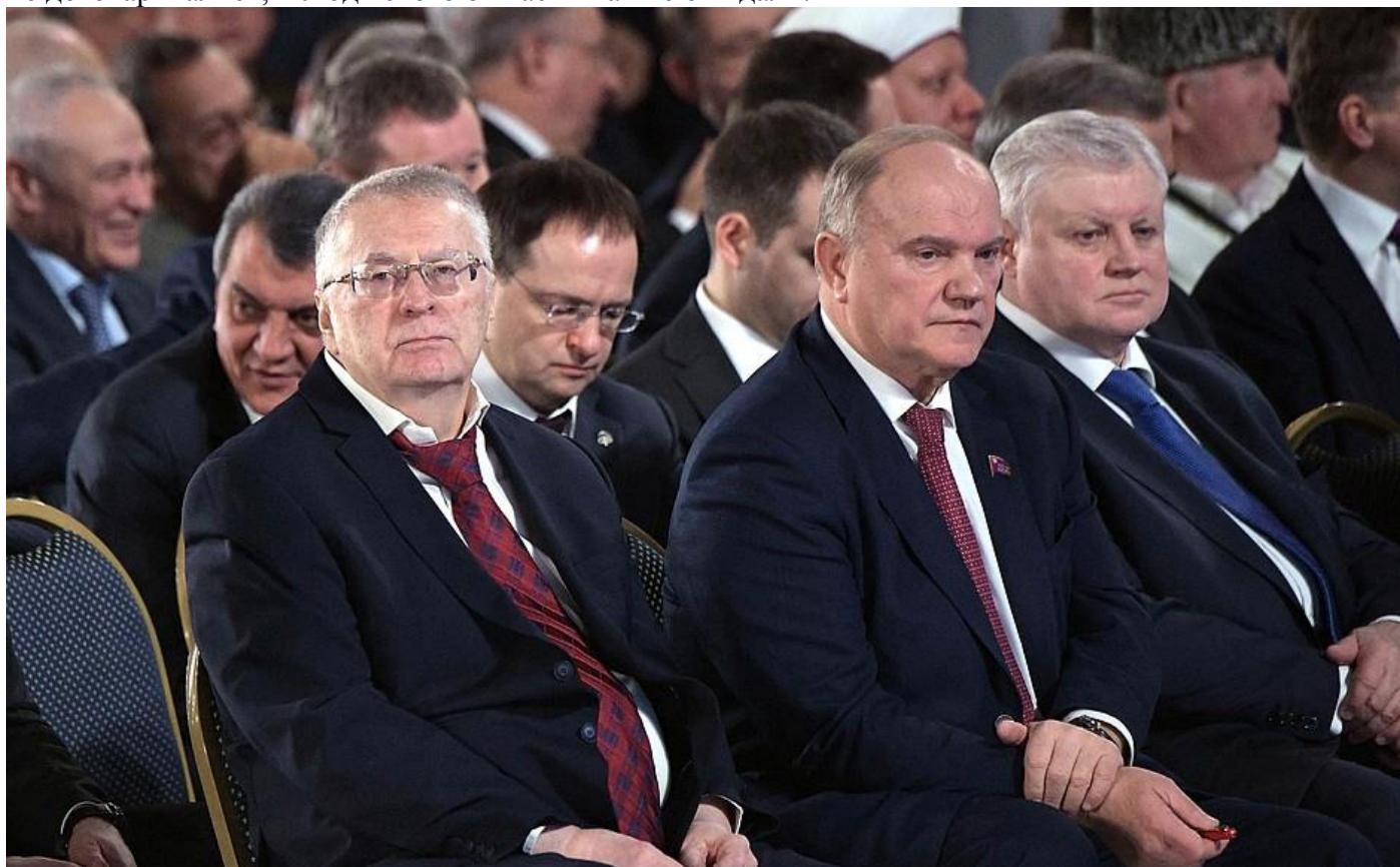
Во время оглашения Послания Президента Федеральному Собранию.

Когда некоторые, в том числе сидящие в этом зале, коллеги убеждали нас и меня в том числе использовать рыночную стоимость недвижимости при расчёте этого налога, они говорили, что старые, устаревшие оценки БТИ – это анахронизм. Однако в реальности оказалось, что кадастровая стоимость, которая вроде бы должна соответствовать рыночной, часто значительно её превышает. Но так не договаривались, и люди этого от нас никак не ожидали.