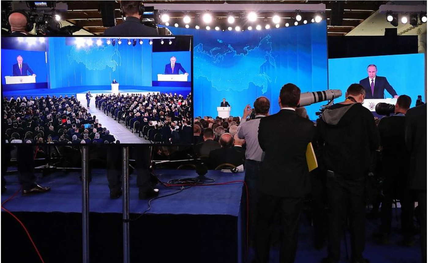
Послание Президента Федеральному Собранию.